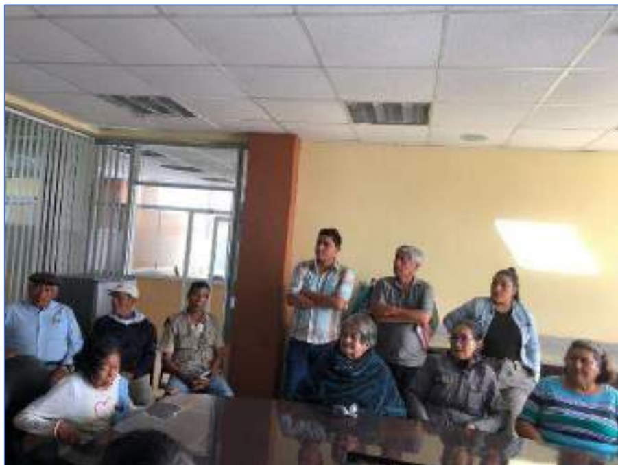
CONVENIO CON LA IGLESIA ESPERANA ETERNA (APOYO A LAS PERSONAS CON DISCAPACIDAD)