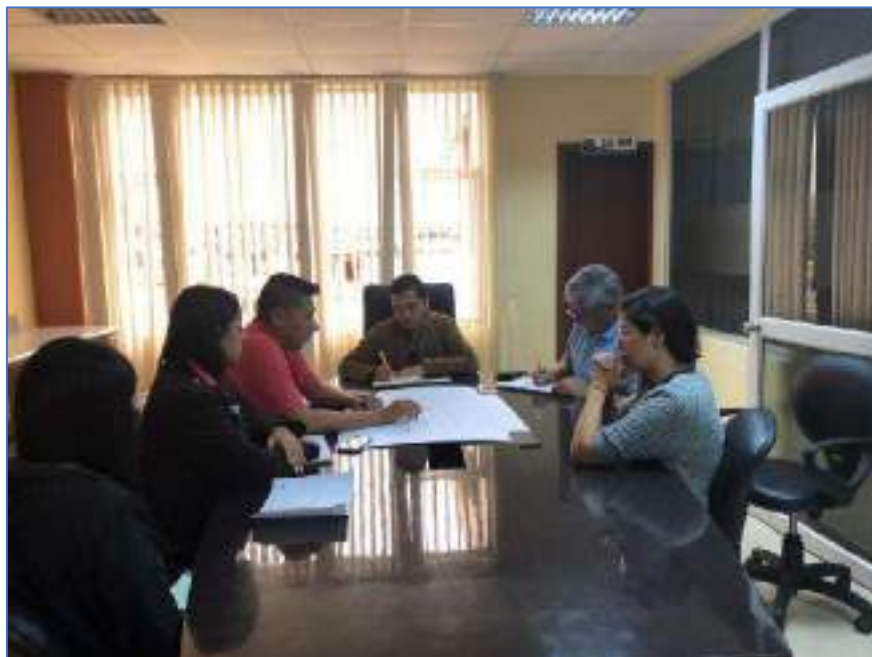
Levantamiento de información del estado del puente colgante sobre el Río Motolo. (Coordinación con tenencia política).