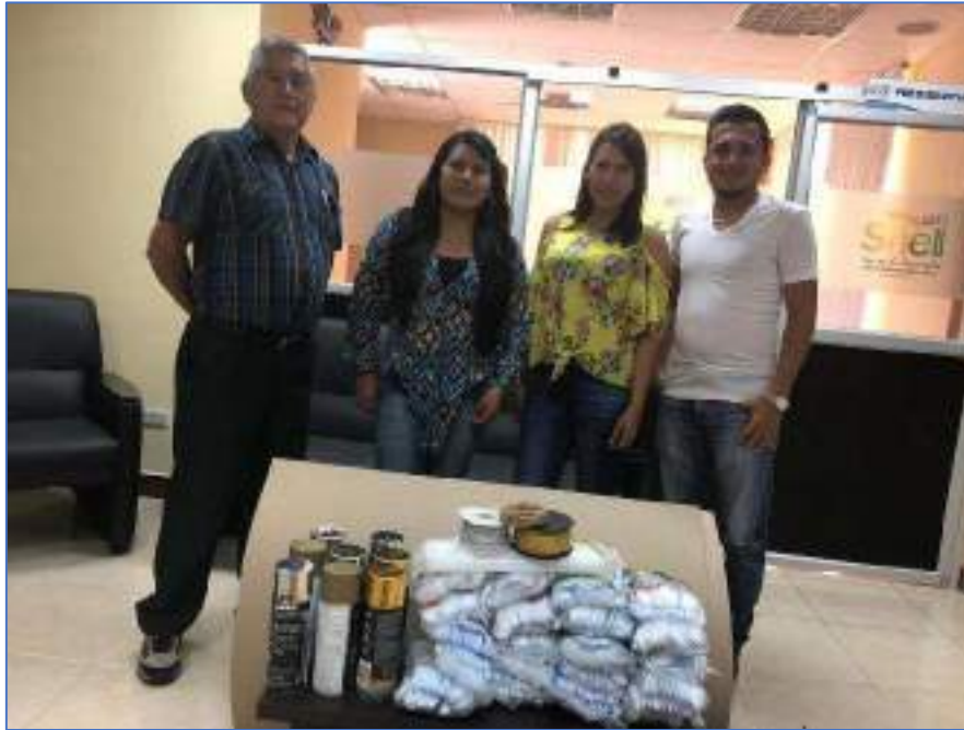
CONVENIO CON LA FUNDACION VIDA ( AYUDA A PERSONAS CON ENFERMEDADES CATASTROFICAS)