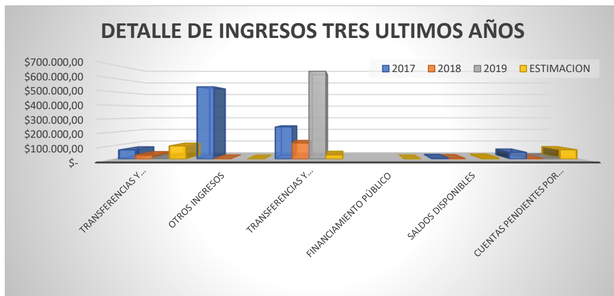
Gráfico 53 Ingresos últimos 3 años